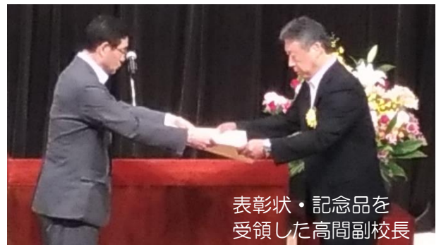
表彰状・記念品を受領した高間副校長